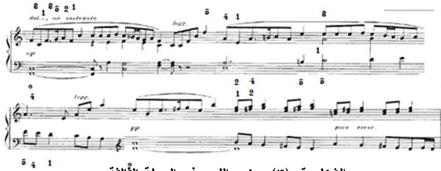
الشكل رقم (٣) يوضح اللحن في الجملة الثالثة

الجملة الثالثة: مبنية على استخدام نماذج ايقاعية سينكوبية، ونماذج لحنية متتالية، يظهر اللحن في الصوت الخارجي باليد اليمنى مع مصاحبة على شكل نغمات كمنزيبوانطية في نفس اليد، والمصاحبة في اليد اليسرى مبنية على استخدام مسافات هارمونية بنماذج ايقاعي ممتدة، استعان المؤلف بالأفواس الزمنية واللحنية في التقسيم العباري، تتسم بالخفوت والأداء المتواصل تنتهي بظهور جزء من اللحن الرئيسي في اليد اليمنى، كما يوضحه الشكل التالي: