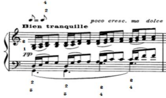
شكل رقم (١١) يوضح التتابع السلمى للمسافات الهارمونية