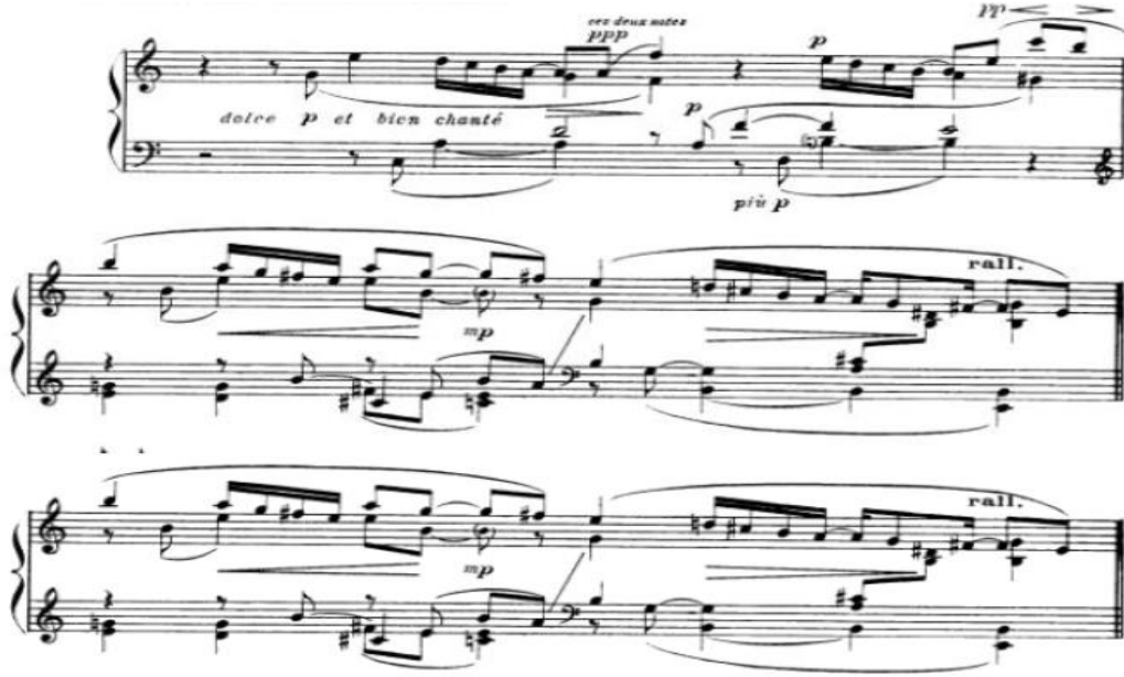
شكل رقم (٨) يوضح الجملة الأولى

اللحن : يتميز اللحن من بداية الجملة بقفزات لليد اليمنى وايضا لليد اليسرى مع استخدام الاقواس اللحنية ولاحظت الباحثة أن المؤلف تجاهل الاشارة الى الميزان للتأكيد على الحرية التامة في أداء عبارات غير متساوية في عدد الوحدات (□) وبالتالي غير متساوية في الطول البنائي. الجملة الأولى: تبدأ من بداية المؤلف وتنتهي بظهور اللحن الرئيسي في اليد اليسرى، غير محددة بخطوط الموازير، وتنتهي بخط مازورة مزدوج، استخدم المؤلف تغيير الميزان بين كما يوضحه الشكل التالي :