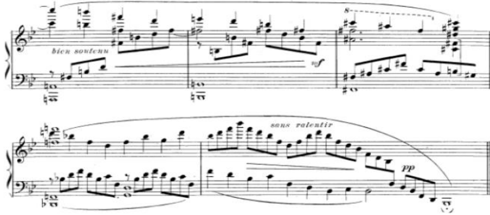
شكل رقم (١٦) يوضح الجملة الثالثة

الجملة الثالثة : تبدأ من البداية بنغمات هارمونية هابطة مع قفزات لليد اليمنى وايضا لليد اليسرى نغمات هارمونية مع قفزات ثلاثية مع استخدام الاقواس اللحنية ولاحظت الباحثة أن المؤلف لم يتجاهل اشارة الميزان للتأكيد على الحرية التامة في أداء عبارات متساوية في عدد الوحدات (□) وبالتالي متساوية في الطول البنائي اداء المقطوعة ببطئ من الجملة الاولى كما موضح بالشكل التالي