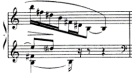
شكل رقم (١٢) يوضح أداء الأربيج